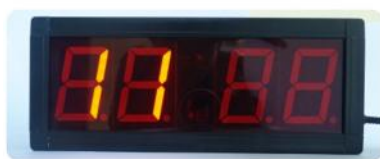
Jika menambah nilai

Jika ingin menyesuaikan tekan tombol UP untuk menambah dan tombol DOWN untuk mengurangi.