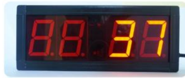
Jika menambah nilai

Jika ingin menyesuaikan tekan tombol UP untuk menambah dan tombol DOWN untuk mengurangi.