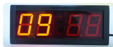
Jika mengurangi nilai