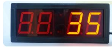
Jika mengurangi nilai